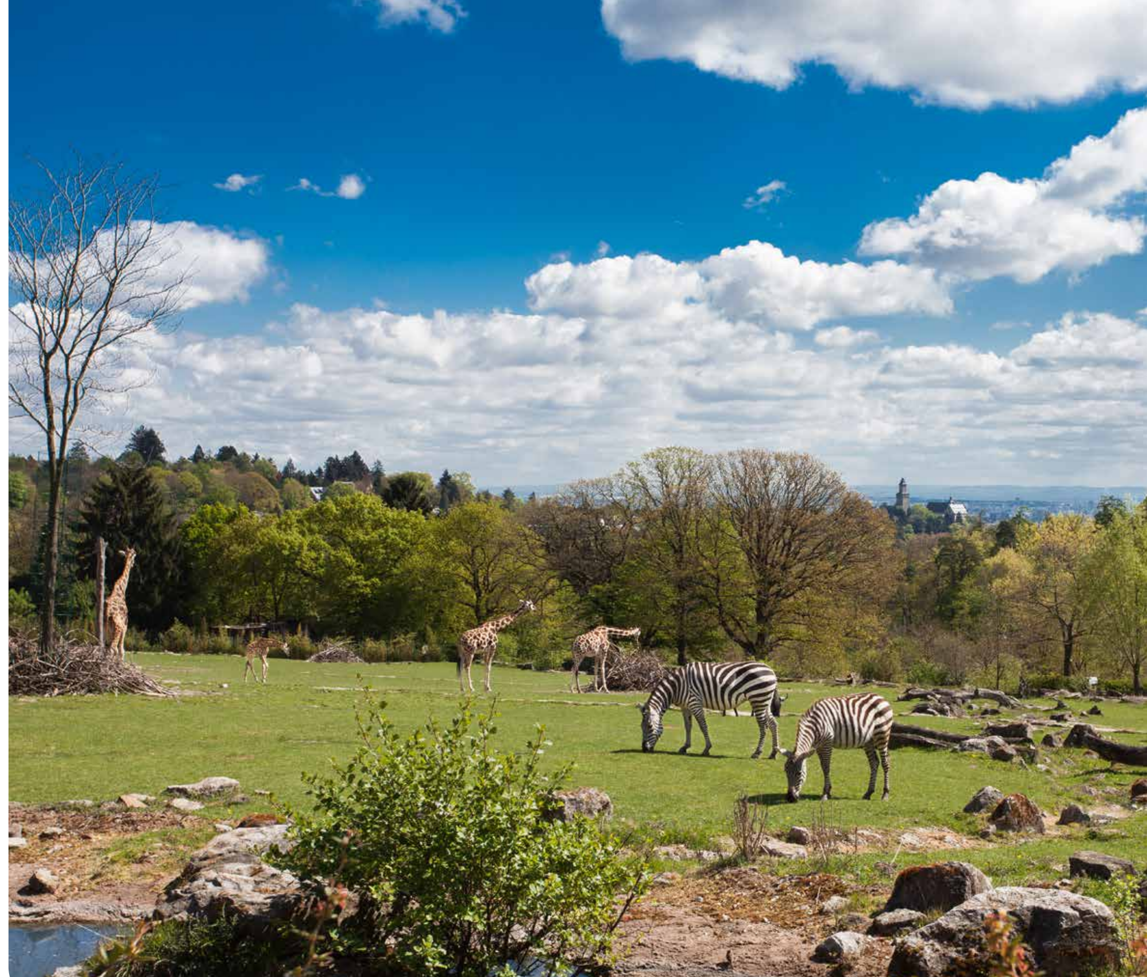
Blick über die Außenanlage „Afrika Savanne“